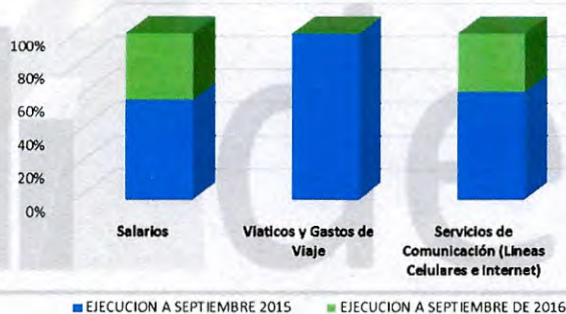
COMPORTAMIENTO GASTOS FUNCIONAMIENTO