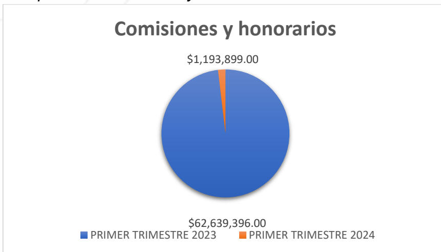
Comparativo comisiones y honorarios Trimestre I 2023 Vs 2024

Nota: Los datos son suministrados como reporte por la Dirección Administrativa y Financiera ADELI.