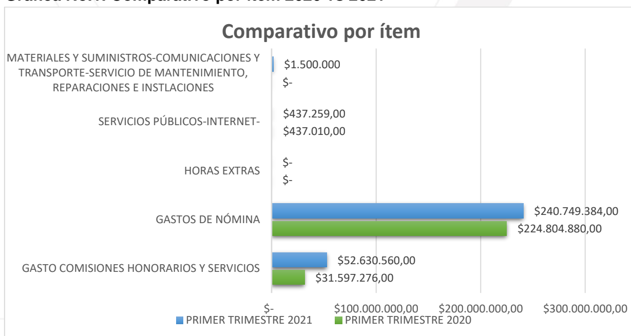
Gráfica No.1. Comparativo por ítem 2020 vs 2021

A continuación, se ilustra mediante gráfica No.1 los valores correspondientes a: gasto comisiones honorarios y servicios, gastos de nómina, horas extras, servicios públicos-internet-, materiales y suministros-comunicaciones y transporte-servicio de mantenimiento, y reparaciones e instalaciones, para el primer trimestre de 2020 y 2021, mostrando las variaciones de un periodo frente al otro.